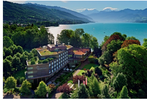
Thun, Seepark Thun und Spital STS AG

Arbeitsteilung und die damit verbundene Bildung von Spezialistenbereichen haben den Vorteil, überlegenes Fachwissen zu entwickeln und den Nachteil der Tendenz zu einer „Silo-Bildung“. In diesem Modul diskutieren wir die Methoden und kommunikativen Voraussetzungen eines IT-gestütztes Prozessmanagements, um die Vorteile professionsbezogener und disziplinärer Spezialisierung zu nutzen und diese gleichzeitig zum Wohle von Patientinnen und Patienten wirksam(er) zu bündeln.