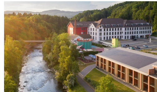
Winterthur, Riverside und KSW

Dieses Modul widmet sich der Vermittlung der wichtigsten Zusammenhänge der finanziellen Führung. Die Teilnehmenden setzen sich mit dem Geschäftsbericht ihres Arbeitgebers, insbesondere mit Bilanz, Erfolgs- und Geldflussrechnung auseinander. Sie erfahren, woher die Zahlen stammen und wie sie zu interpretieren sind. Anhand von Fallstudien wird gezeigt, wie ein benutzerfreundliches Controlling inkl. Kostenrechnung aufgebaut ist.