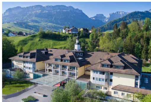
Weissbad, Hotel Hof Weissbad

In diesem Modul steht das Management von Veränderungsprozessen im Mittelpunkt. Wenn Wandel immer mehr zu einer Konstante wird, müssen auch Spitäler systematisch an der Fähigkeit arbeiten, Neuerungen frühzeitig zu initiieren und kulturverträglich umzusetzen. Im Zentrum stehen die gewinnende Mobilisierung und Vernetzung von Menschen, die rasche Schaffung einer tragfähigen Legitimationsgrundlage für Neuerungen und der respektvolle Umgang mit unterschiedlichen Traditionen, Perspektiven und Professionsidentitäten.